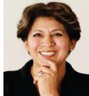
20. MORENA Delfina Gómez Álvarez