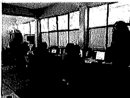
Visita de Asesoría CONALITEG 02/02/2017.

Por este medio informo que el personal de la Supervisión Escolar asiste a todas y cada una de las escuelas adscritas a la misma con la finalidad de realizar acompañamientos académicos, administrativos e incluso sociales; existe evidencia de ello, anexo algunas fotografías de lo descrito y en particular de la escuela en referencia.