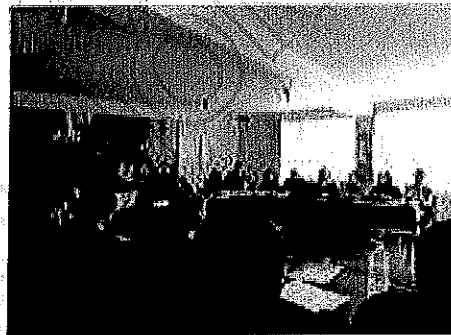
Visita de Asesoría Planificación 15/03/2017.