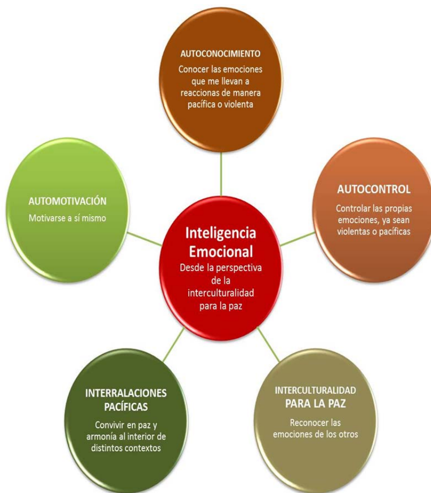
Gráfica 3 Inteligencia emocional desde la perspectiva de la Cultura para la Paz