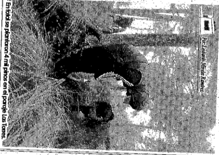
En total se plantaron 4 mil pinos en el paraje Las Torres.