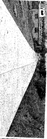
Las obras se realizan con concreto hidráulico.

Los vecinos beneficiados agradecieron a las autoridades el trabajo realizado en sus respectivas localidades, en tanto el alcalde reiteró una vez más su compromiso de ejercer un gobierno responsable.