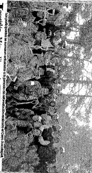
Los participantes se surtaron entusiastas a lo jornada de reforestación en el Cerro Xocotepetl.

Jocotitlán, Méx.- El pasado sábado, el Ayuntamiento que preside Iván Esquer Cruz llevó a cabo una jornada de Reforestación en el Cerro Xocotepetl, en la que se proyecta plantar 4 mil pinos en el paraje Las Torres.