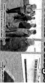
Respecto a los apoyos entregados, afirmó que cabe señalar que la inversión para la entrega de las estufas ecológicas a las familias beneficiarias es de 300 mil pesos y que proviene de los recursos que se manejan en el municipio de Jocotitlá.

Respecto a los apoyos entregados, afirmó que cabe señalar que la inversión para la entrega de las estufas ecológicas a las familias beneficiarias es de 300 mil pesos y que proviene de los recursos que se manejan en el municipio de Jocotitlá. En este sentido, destacó que el Gobierno Federal y el Gobierno del Estado de Oaxaca han brindado un apoyo importante a las poblaciones de Jocotitlá para la entrega de las estufas ecológicas a las familias beneficiarias que se ha brindado por el Gobierno Federal y el Gobierno del Estado de Oaxaca.