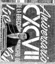
El gobernador Oswaldo Chavarría reconoce a los contratadores sociales de Morelos.