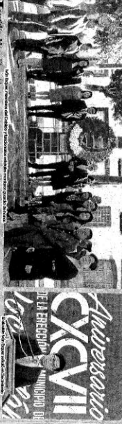
El gobernador Oswaldo Chavarría reconoce a los contratadores sociales de Morelos.

Thomson la conmemoración del aniversario de la creación del estado de Jalisco, definió por este municipio su identidad en un día de fiesta y memoria.