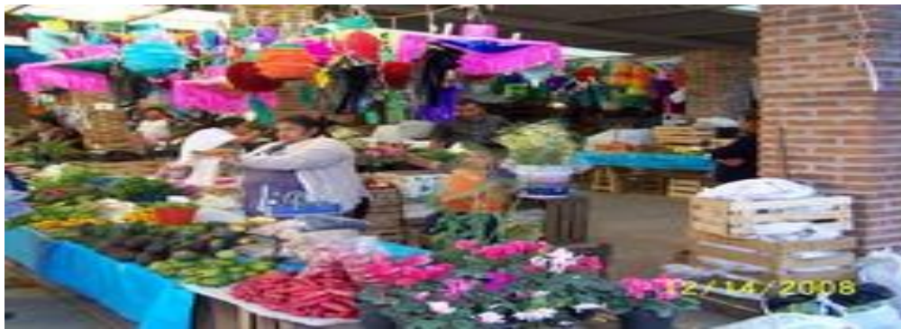
(arriba, Mercado de Gualupita)